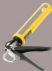
Пистолет под клей