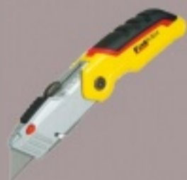
Строительный нож (усиленный)